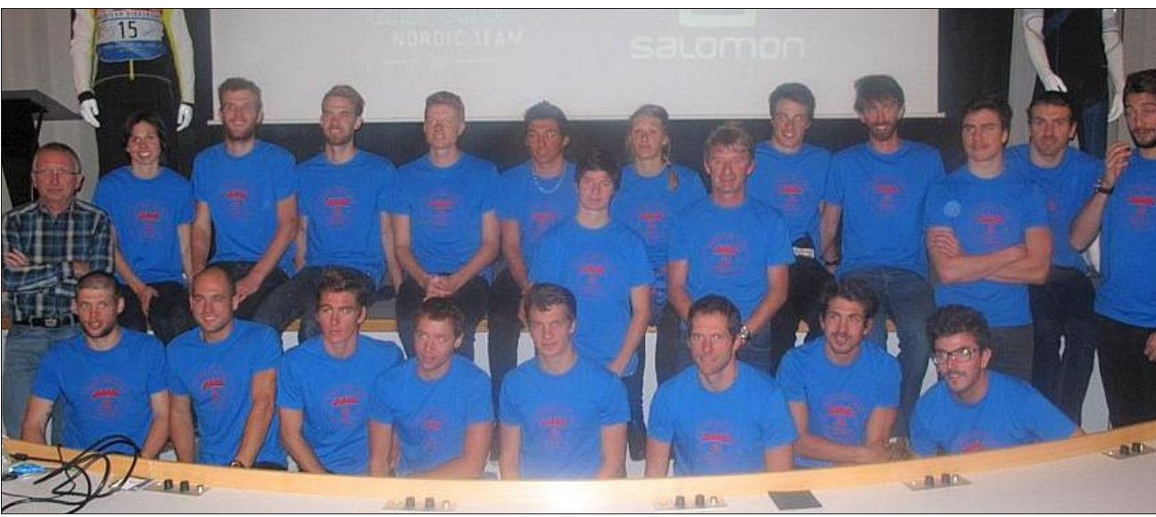
17 des 19 membres du Haute-Savoie Nordic Team, le staff et un représentant de la marque Salomon étaient présents hier pour la signature du partenariat.

Hier, un nouveau pas a été franchi puisqu'un partenariat portant sur le textile a été signé avec la marque Salomon, soucieuse de s'implanter dans le secteur du ski nordique. Mais, ce qui a été souligné par les deux parties, c'est que cette