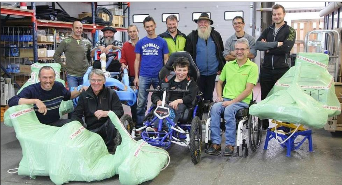
Entourés d'accompagnateurs, et de sherpas sur place, les quatre handicapés en fauteuil tout-terrain vont pouvoir vivre une aventure unique dans la vallée du Mustang au Népal. Un trek qui sera suivi par une équipe de France Télévisions.

Ce projet est à l'initiative de Michel Veisy, guide de haute montagne, qui s'appuiera sur l'expérience d'une première expédition de ce genre en 2013 où il avait piloté un groupe pour faire le tour des Annapurnas. Sur place, les trekkers seront pris en charge par six sherpas et 40 porteurs pour assurer le transport de 800 kilos de matériel. Un recrutement assuré par l'agence Nima qui permettra aussi d'apporter des subsides à une population qui a beaucoup souffert du dernier tremblement de terre.